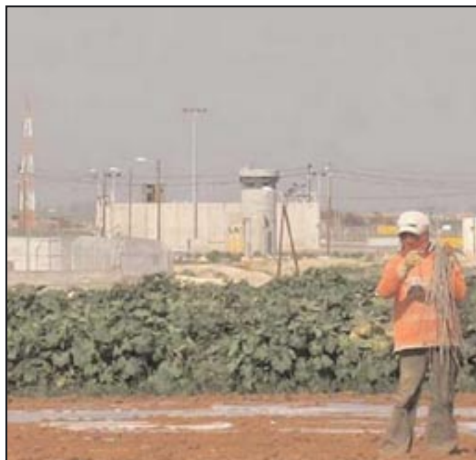
Eine typische Szene in Palästina: Landwirtschaft im Schatten der Mauer

52.000 Palästinenser leben permanent im Tal, zusammen mit anderen Landbesitzern, die ihren Wohnsitz in den Städten der West-Bank haben. Viele andere Palästinenser kommen saisonal in das Tal, von den Bergen im Westen, um ihr Land zu bestellen und ihre Herden weiden zu lassen. Mittlerweile befinden sich die Wohngebiete hauptsächlich um Jericho herum sowie in 24 Dörfern und Beduinen-Gemeinden.